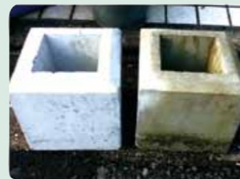
6ヶ月経過後の写真(右塗布・左未塗布)

黒カビや雨垂れで黒ずんでしまったコンクリート面やタイル面も、ナノスーパーWR[建築用]が強固に守り、建物の美しさと強さを保ちます。