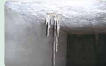
※既存のエフロについてはナノスーパーWR[建築用]を施工する前に除去が必要です。

将来のエフロ予防だけでなく、すでにエフロが発生している箇所も、ナノスーパーWR[建築用]を塗布するだけで、エフロ再発を抑制できます。