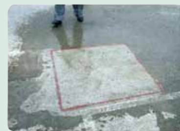
北海道屋上駐車場コンクリート床 6年経過後の写真(赤枠内のみの試験施工)

ナノスーパーWR[建築用]は氷点下20℃までの温度環境でも施工可能です。凍結融解や融雪剤など、コンクリートにとって厳しい環境でも優れた効果を発揮します。